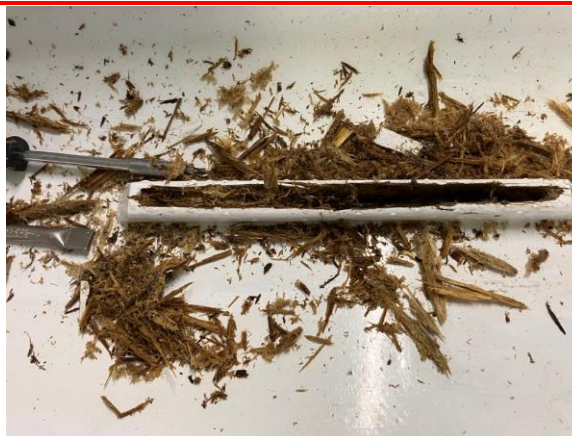
Houtrot in Markus

Vroegere nieuwsbrieven vind je ook op onze website the-oar.be/nieuwsbrief.htm