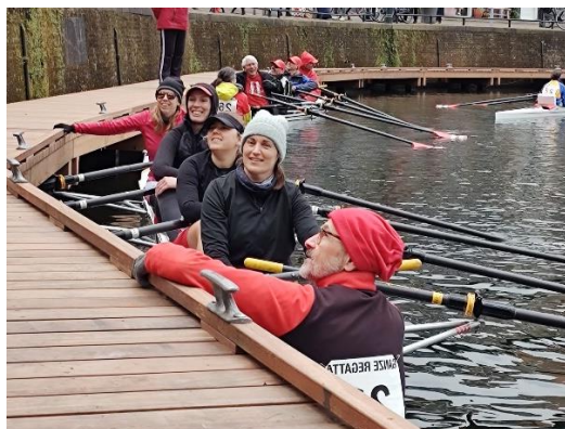
Ready for Goes

Vroegere nieuwsbrieven vind je ook op onze website the-oar.be/nieuwsbrief.htm