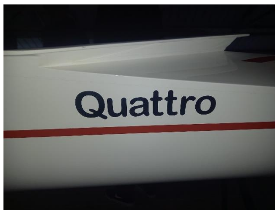
Quattro, Quattro is the name

Vroegere nieuwsbrieven vind je ook op onze website the-oar.be/nieuwsbrief.htm