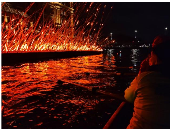
Amsterdam bij Light

Vroegere nieuwsbrieven vind je ook op onze website the-oar.be/nieuwsbrief.htm