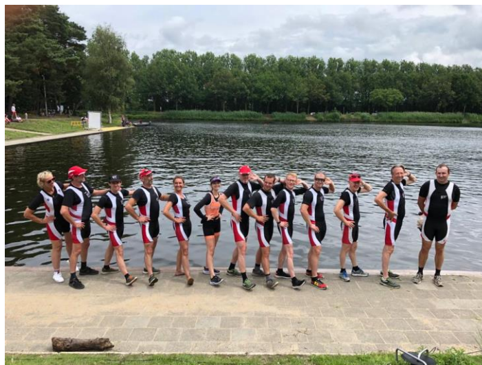
De DMO-ers (zoek de Amerikaanse stuurvrouw)

Vroegere nieuwsbrieven vind je ook op onze website the-oar.be/nieuwsbrief.htm