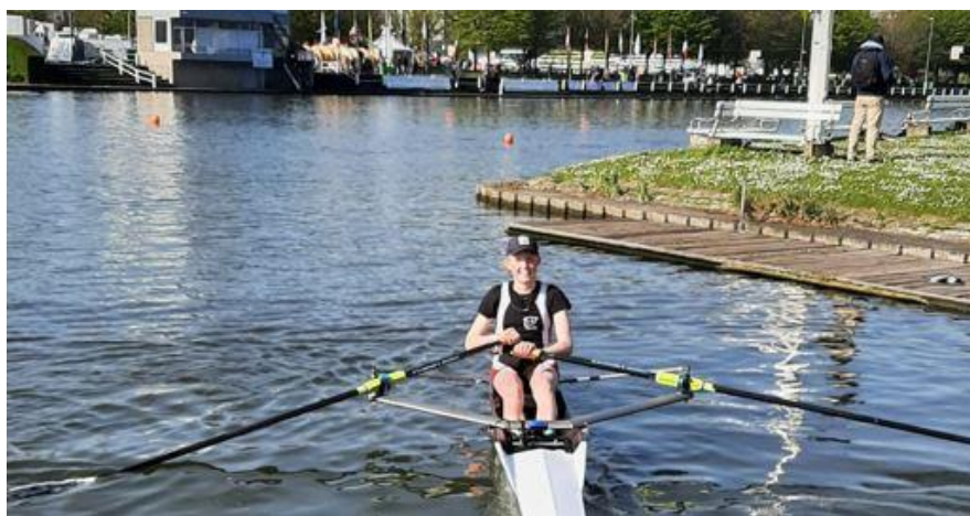
Lore op weg naar de volgende overwinning

Vroegere nieuwsbrieven vind je ook op onze website the-oar.be/nieuwsbrief.htm