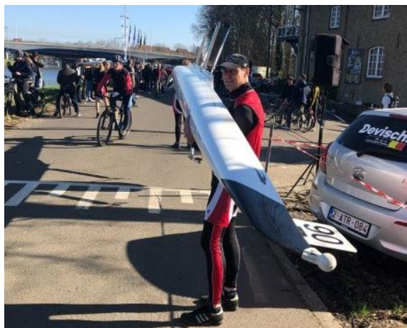
Eerste waterwedstrijd na corona : BBR

Vroegere nieuwsbrieven vind je ook op onze website the-oar.be/nieuwsbrief.htm