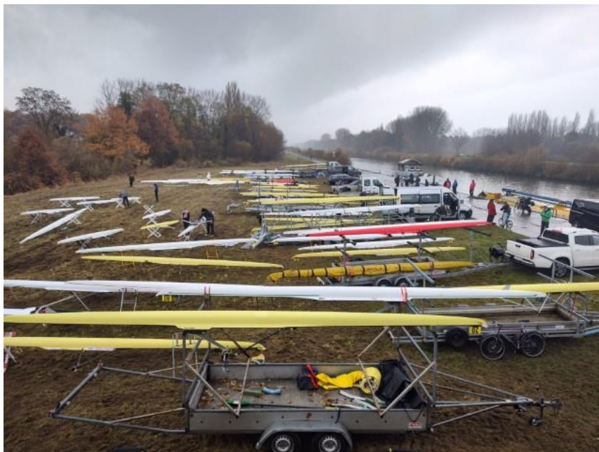
Een wei vol boten

Vroegere nieuwsbrieven vind je ook op onze website the-oar.be/nieuwsbrief.htm