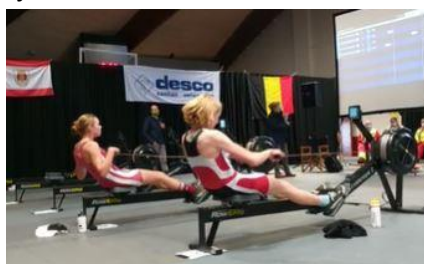
Lore - 7.40