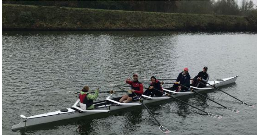
Lore, onze nieuwe stuur

Vroegere nieuwsbrieven vind je ook op onze website the-oar.be/nieuwsbrief.htm