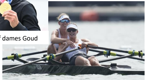
Dubbel skull dames Zilver