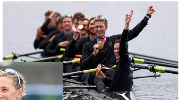
Acht met stuurman heren Goud