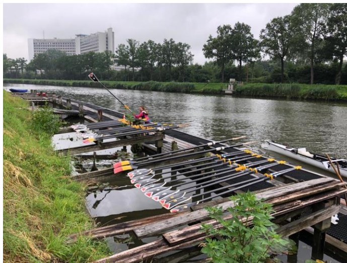
Start van het toerroekamp in Brugge

Vroegere nieuwsbrieven vind je ook op onze website the-oar.be/nieuwsbrief.htm