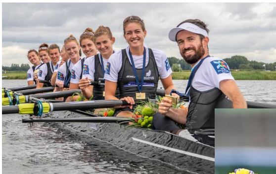
Acht met stuurman dames Zilver

Deze ploegen trainden in 2019 in Emblem op het Netekanaal voor hun Europese campagne om de Olympische selecties te halen.