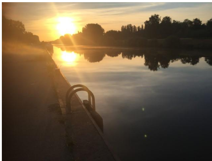
Echt ochtend roeien op een zomers dag : daarom !!

Vroegere nieuwsbrieven vind je ook op onze website the-oar.be/nieuwsbrief.htm