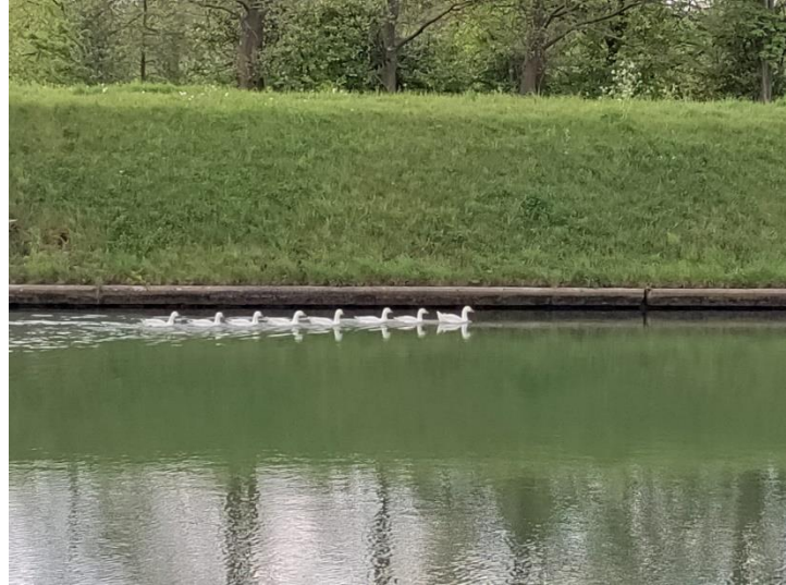
Eerste acht op het water dit jaar

Vroegere nieuwsbrieven vind je ook op onze website the-oar.be/nieuwsbrief.htm