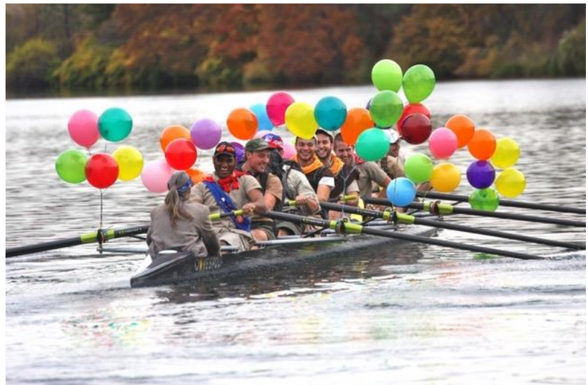
Terug uitzicht op samen roeien ? Hopelijk 1 april 2021

Vroegere nieuwsbrieven vind je ook op onze website the-oar.be/nieuwsbrief.htm