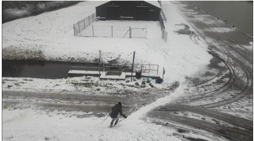
Winterse tijden vragen om kaiserschmarren !

Vroegere nieuwsbrieven vind je ook op onze website the-oar.be/nieuwsbrief.htm