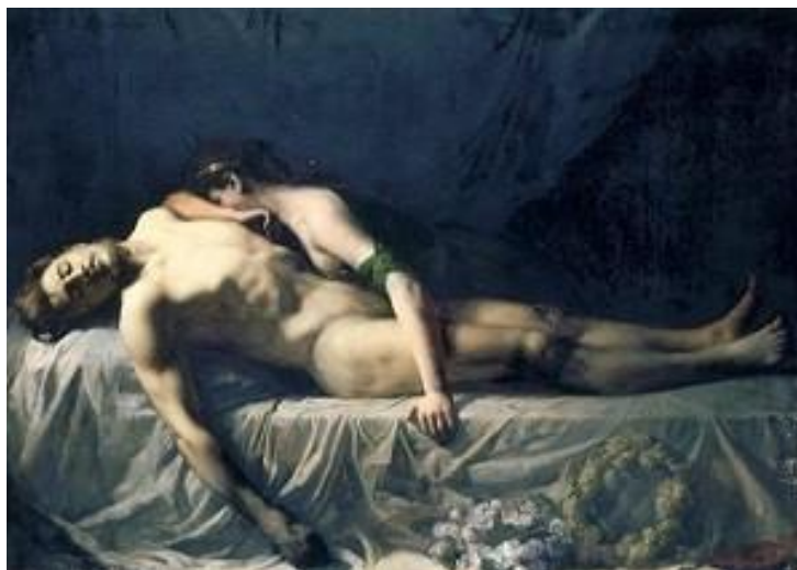
Een volgend kunstwerk in onze roeigerelateerde-kunstreeks : Briseïs

Vroegere nieuwsbrieven vind je ook op onze website the-oar.be/nieuwsbrief.htm