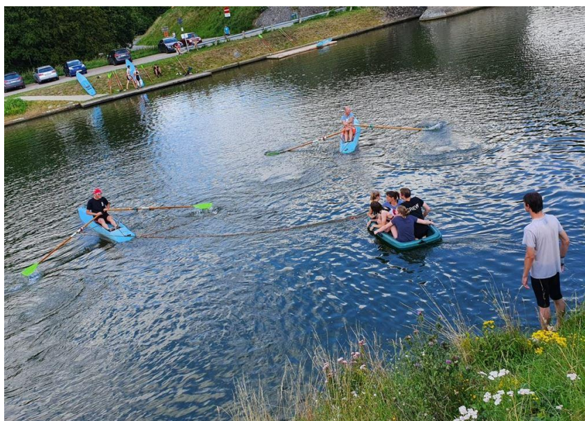
Nieuwe discipline op de zomerhappening : sleepbootje

Vroegere nieuwsbrieven vind je ook op onze website the-oar.be/nieuwsbrief.htm