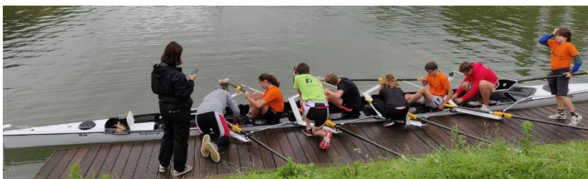
Een degelijke ondersteuning door ons jeugdig OAR-team op het Sport-it kamp

Vroegere nieuwsbrieven vind je ook op onze website the-oar.be/nieuwsbrief.htm