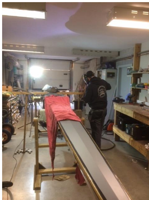
Een lasser aan het werk in onze roeigerelateerde-kunstreeks

Vroegere nieuwsbrieven vind je ook op onze website the-oar.be/nieuwsbrief.htm