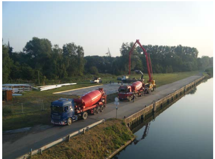
Storten van de vloerplaat voor het clubhuis

Oude nieuwsbrieven vind je ook op onze website the-oar.be/nieuwsbrief.htm