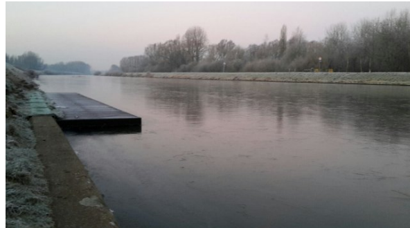
Zoek de zeven verschillen

Oude nieuwsbrieven vind je ook op onze website the-oar.be/nieuwsbrief.html .